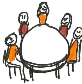
TABLE RONDE : DIALOGUE ENTRE GÉNÉRATIONS