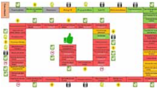
Exemple de visuel de l'avancement d'actions d'une commune.

Pour aider à l'appropriation de la démarche, un plan d'actions sous forme de « jeu de l'oie » interactif est mis à la disposition des communes. Chaque case représente une action à mettre en place, des fiches expliquant son intérêt y sont associées. Une fois l'action réalisée, la case passe au vert ce qui visuellement reflète l'état d'avancement de la commune. Cet outil n'a rien de contraignant, il est là pour vous accompagner, vous guider dans la mesure où vous vous l'appropriiez.